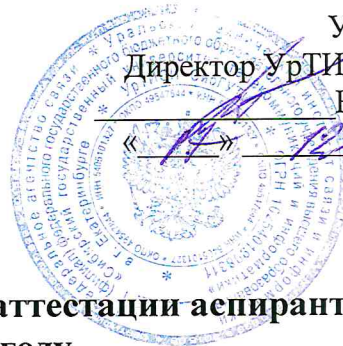
ГРАФИК проведения государственной итоговой аттестации аспирантов в 2018/2019 учебном году (по программам подготовки научно-педагогических кадров) Аспирантура