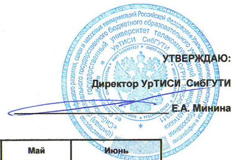
ГРАФИК УЧЕБНОГО ПРОЦЕССА студентов факультета непрерывного обучения (заочная форма обучения) на 2023 - 2024 учебный год Обучение по индивидуальному учебному плану

Уральский технический институт связи и информатики (филиал) в г. Екатеринбурге (УрТИСИ СибГУТИ)