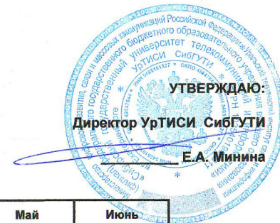
ГРАФИК УЧЕБНОГО ПРОЦЕССА студентов магистратуры факультета непрерывного обучения (заочная форма обучения) на 2023 - 2024 учебный год

Уральский технический институт связи и информатики (филиал) в г. Екатеринбурге (УрТИСИ СибГУТИ)