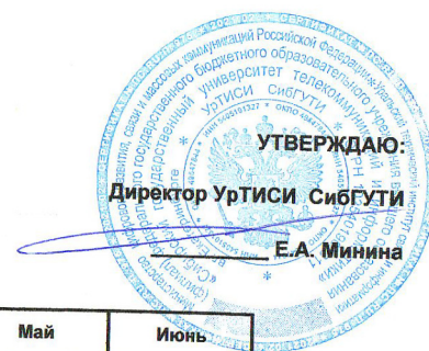
ГРАФИК УЧЕБНОГО ПРОЦЕССА студентов магистратуры факультета непрерывного обучения (заочная форма обучения) на 2023 - 2024 учебный год