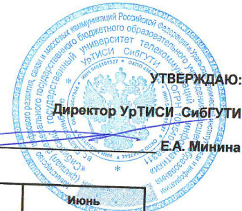
ГРАФИК УЧЕБНОГО ПРОЦЕССА студентов факультета непрерывного обучения (заочная форма обучения) на 2023 - 2024 учебный год Обучение по индивидуальному учебному плану

Уральский технический институт связи и информатики (филиал) в г. Екатеринбурге (УрТИСИ СибГУТИ)