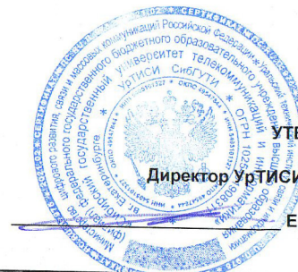
ГРАФИК УЧЕБНОГО ПРОЦЕССА студентов факультета непрерывного обучения (заочная форма обучения) на 2021 - 2022 учебный год Обучение по индивидуальному учебному плану

Уральский технический институт связи и информатики (филиал) в г. Екатеринбурге (УрТИСИ СибГУТИ)