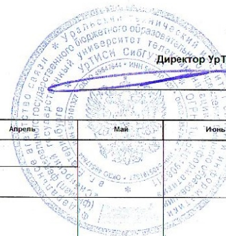
ГРАФИК УЧЕБНОГО ПРОЦЕССА студентов факультета непрерывного обучения (заочная форма обучения) на 2020- 2021 учебный год

Уральский технический институт связи и информатики (филиал) в г. Екатеринбурге (УрТИСИ СибГУТИ)