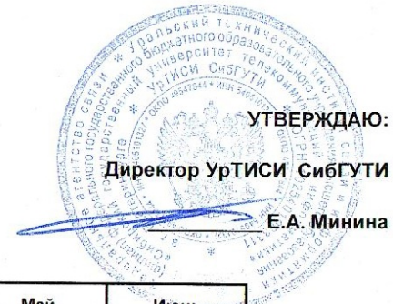
ГРАФИК УЧЕБНОГО ПРОЦЕССА студентов магистратуры факультета непрерывного обучения (заочная форма обучения) на 2020 - 2021 учебный год

Уральский технический институт связи и информатики (филиал) в г. Екатеринбурге (УрТИСИ СибГУТИ)