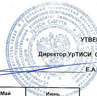
ГРАФИК УЧЕБНОГО ПРОЦЕССА студентов факультета непрерывного обучения (заочная форма обучения) на 2020 - 2021 учебный год Обучение по индивидуальному учебному плану

Уральский технический институт связи и информатики (филиал) в г. Екатеринбурге (УрТИСИ СибГУТИ)