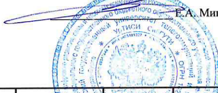
ГРАФИК УЧЕБНОГО ПРОЦЕССА УрТИСИ СибГУТИ на 2023/2024 учебный год