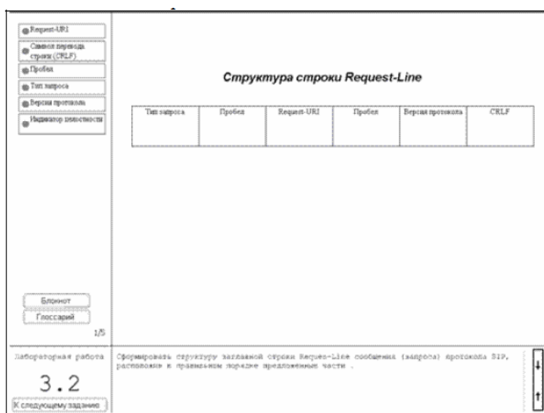
Рисунок 1 – Пример выполнения задания практической работы