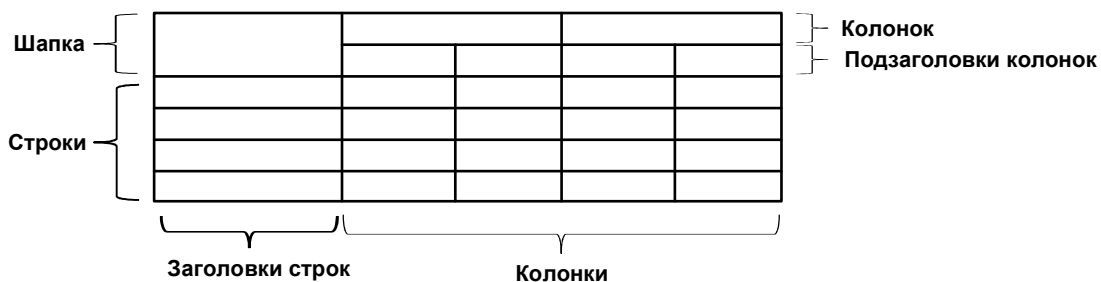
Рисунок 2.1 – Построение таблицы

2.3.1 Таблицы применяют для лучшей наглядности и удобства сравнения показателей (пример рисунок 2.1).