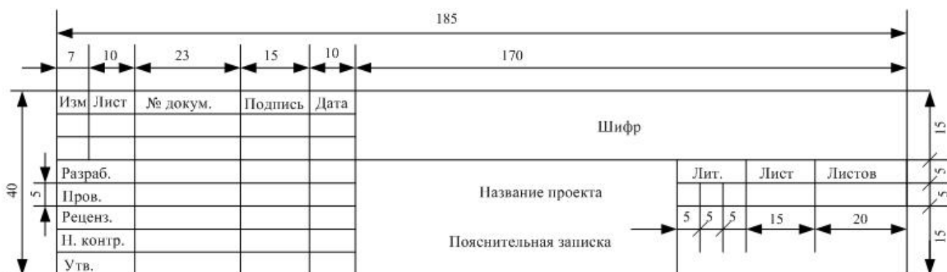
Рисунок Е.1 – Штамп листа содержания текстового документа